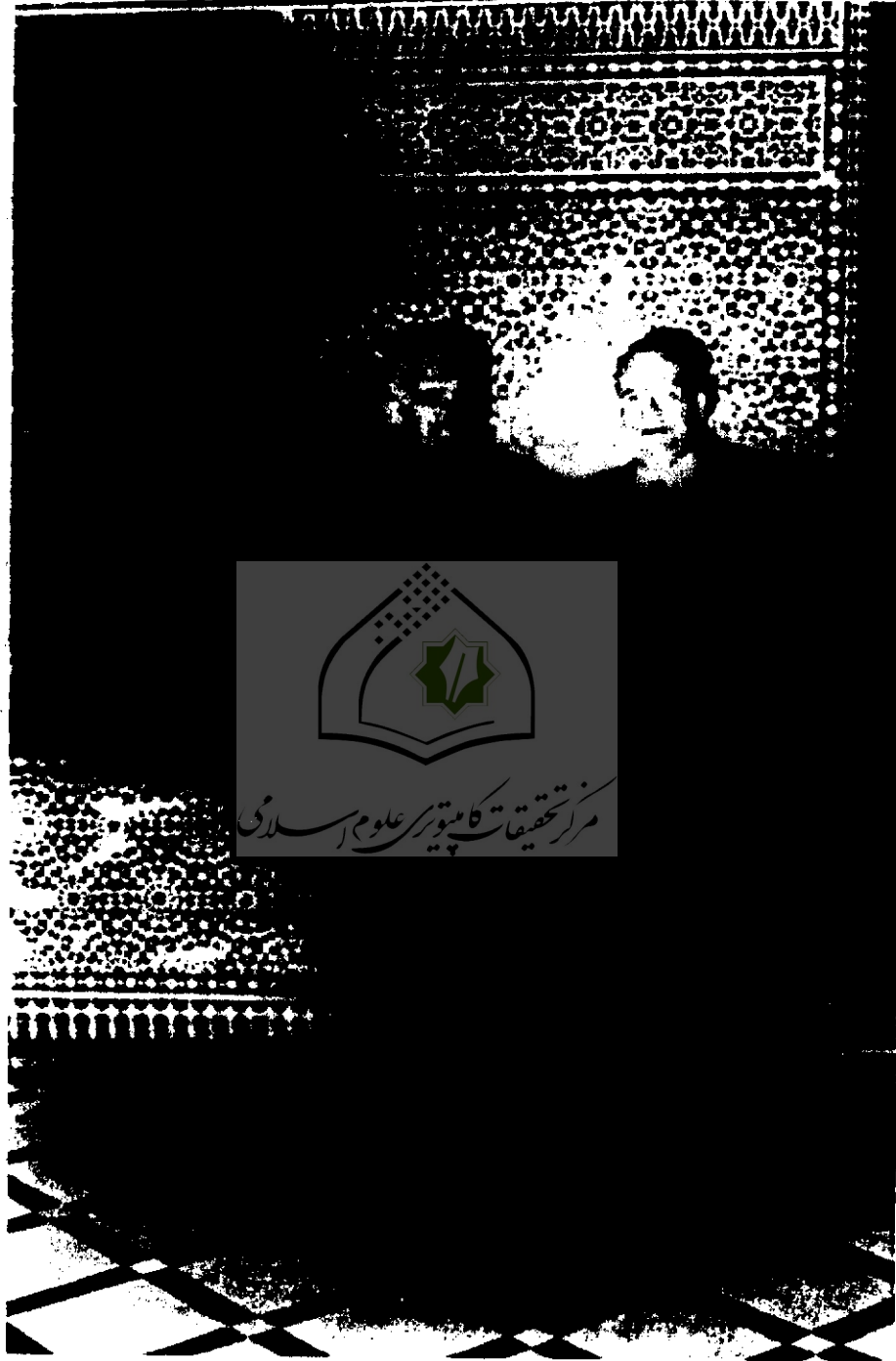
فضيلة الأستاذ الدكتور ناصر الدين الأسد رئيس المجمع الملكي لبحوث الحضارة الإسلامية بالمملكة الأردنية الهاشمية في زيارة لدار الحديث الحسنية.