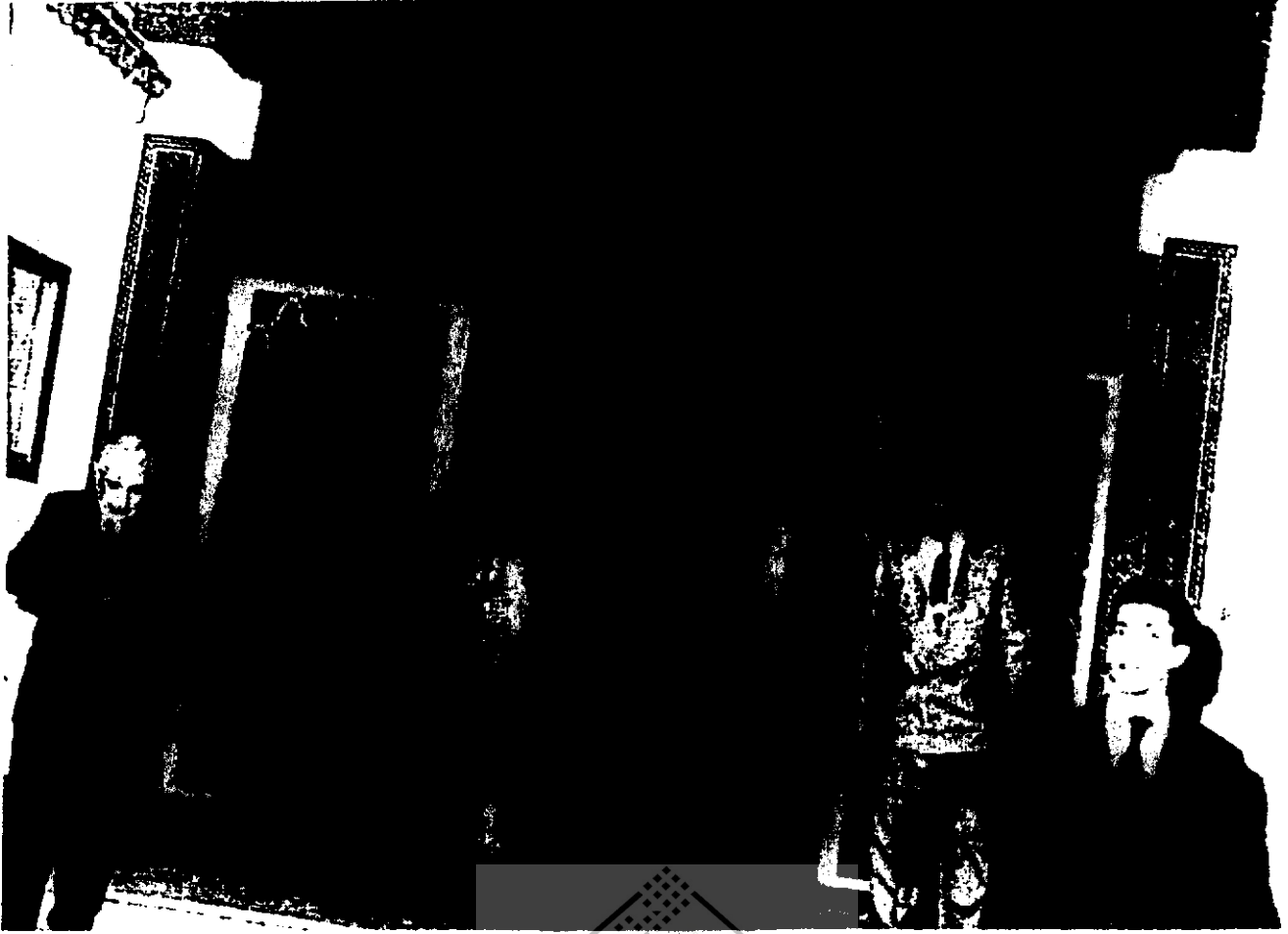
مدير دار الحديث الحسنية يستقبل معالي الدكتور محمود حمدي زقزوق وزير الأوقاف بجمهورية مصر العربية والوفد المرافق له.