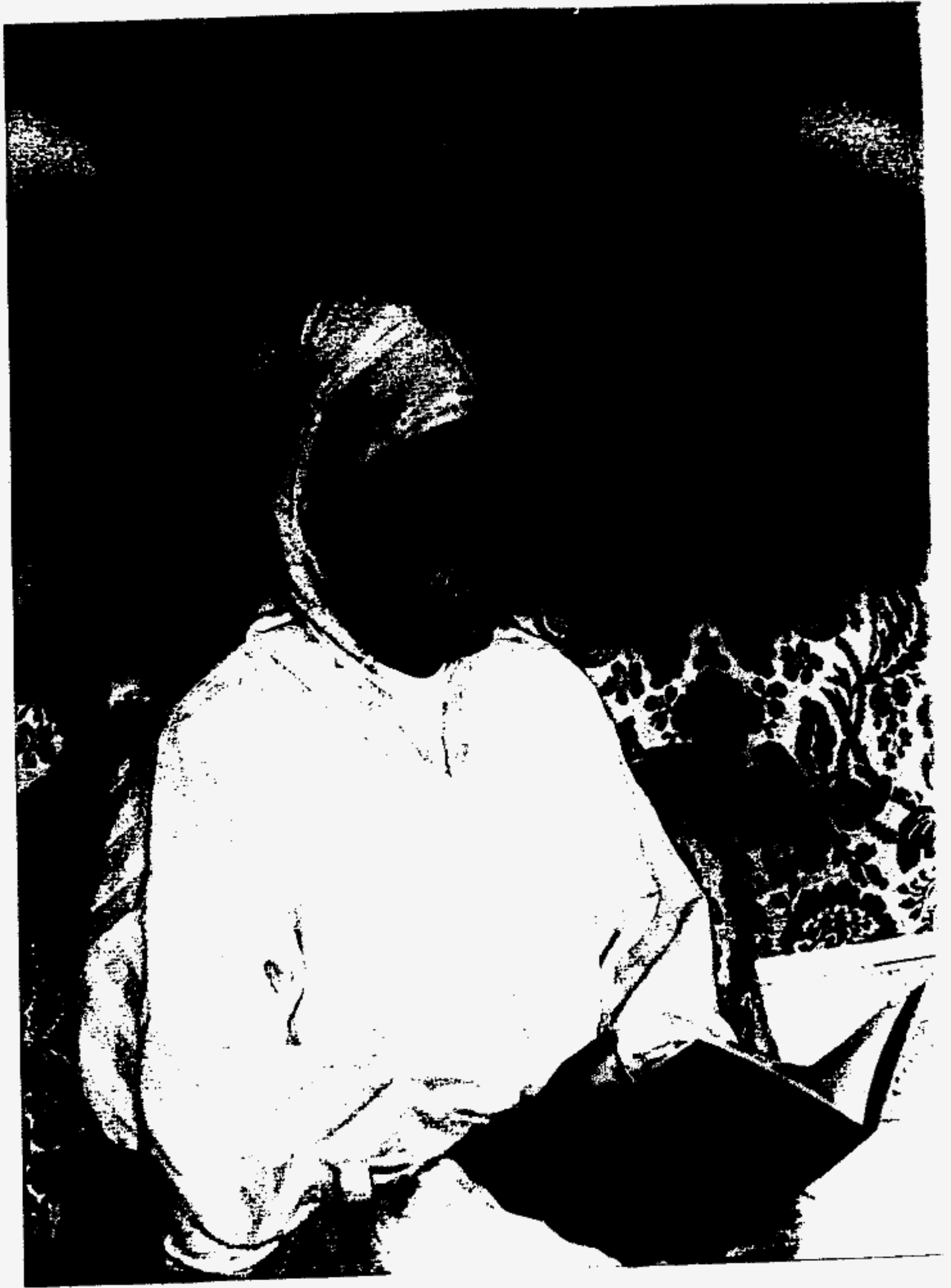
أمير المؤمنين جلالة الملك الحسن الثامن نصره الله تعالى في صلاة الجمعة