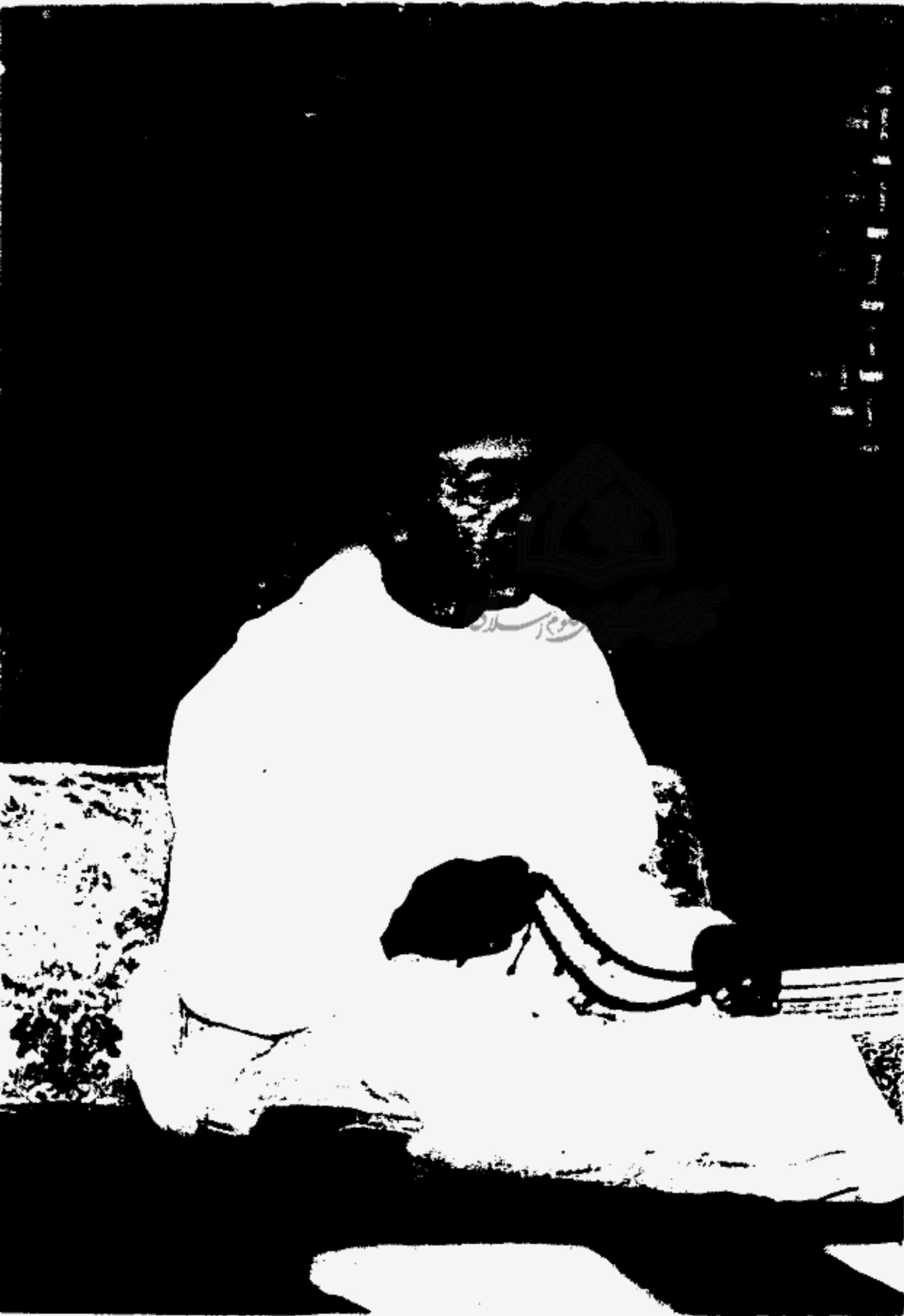
مولانا أمير المؤمنين جلالة الملك الحسن الثاني نصره الله وأيده