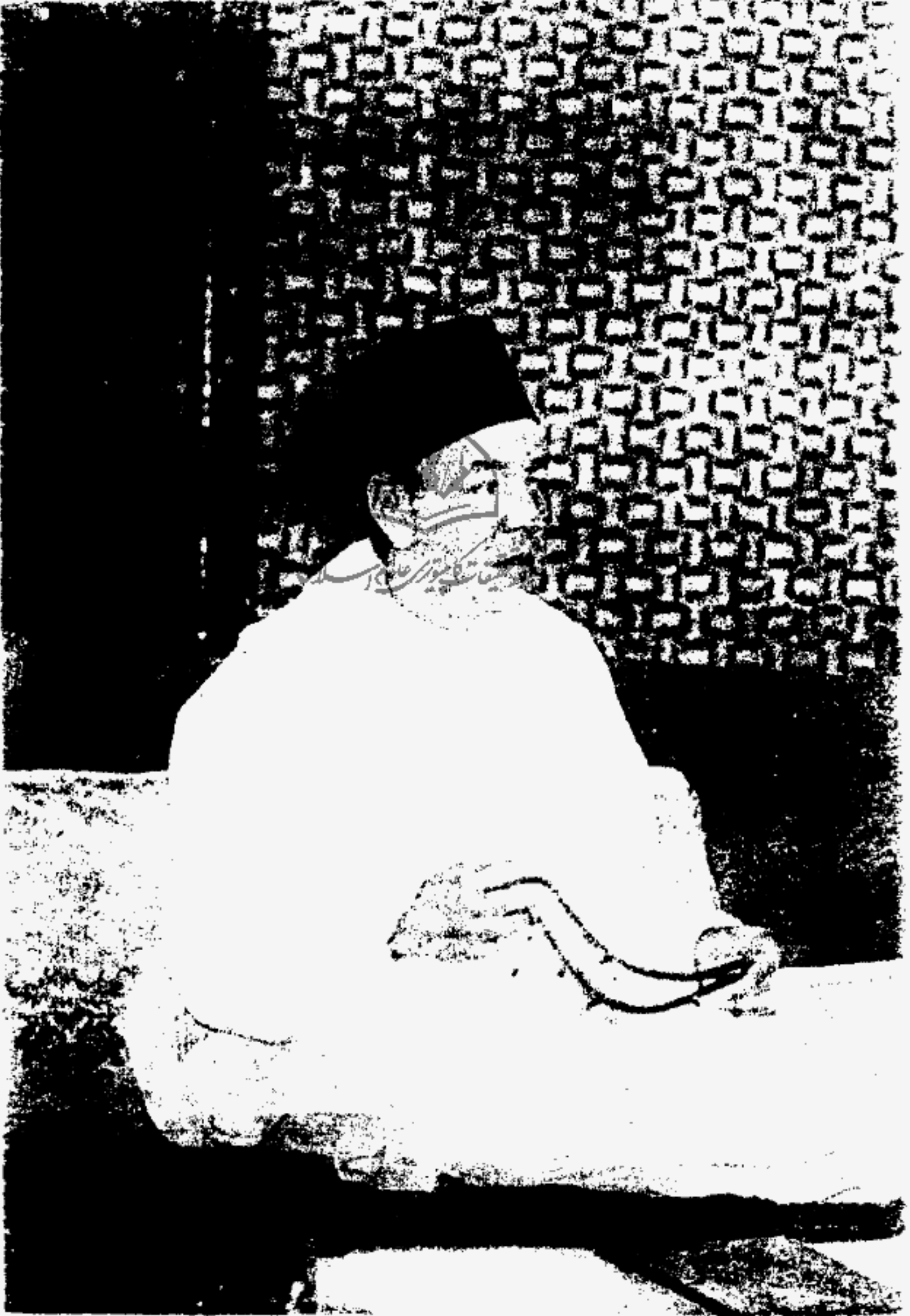
مولانا امير المؤمنین جلالۃ الملک الحسن الثانی نصرہ اللہ وایسده